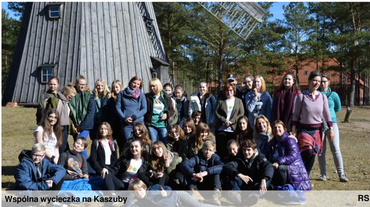
Wspólna wycieczka na Kaszuby