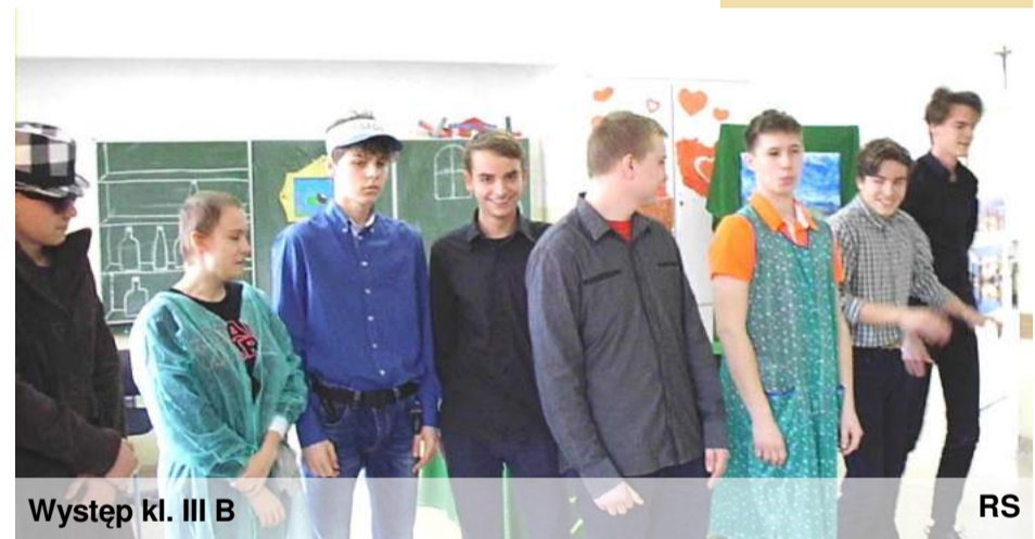
Występ kl. III B