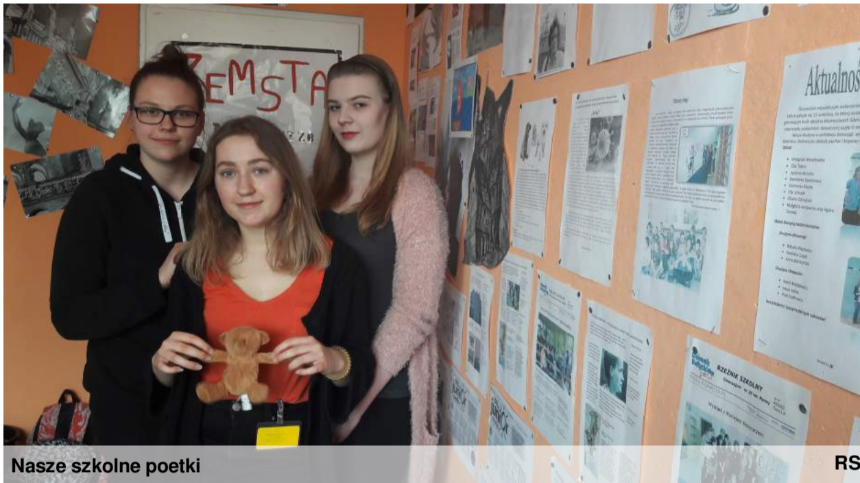
Nasze szkolne poetki